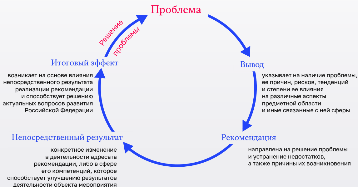
Схема соотношения рекомендации, непосредственного результата и итогового эффекта ее реализации